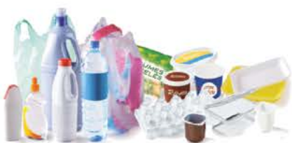
Tous les emballages plastiques