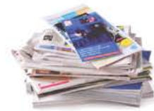
Tous les papiers